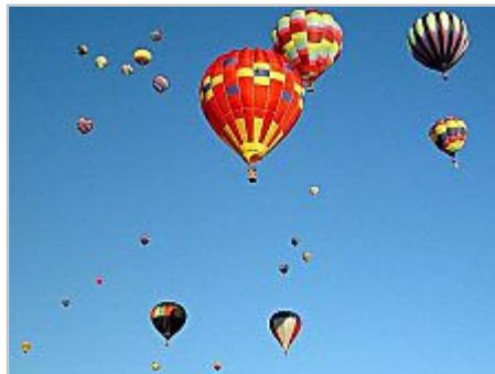
In Albuquerque steigen jedes Jahr Hunderte von Ballons in die Lüfte.