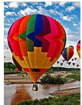
Bei der Balloon Fiesta flie dorthin, wo es sie gerade Albuquerque Internationa Inc/dpa/tmn)

Dass es etwas länger dauert , diese extravaganten Gebilde startklar zu machen, stört Russ nicht. Im Gegenteil: «Ich finde das schräg, was die Leute alles machen», sagt der 53-Jährige, der in Minnesota sein Hobby zum Beruf gemacht hat und dort Ballonfahrten anbietet. Er allerdings bleibt lieber bei seinem roten Schirm mit den kleinen weißen Rauten - allzu viel Abenteuer muss auch nicht sein.